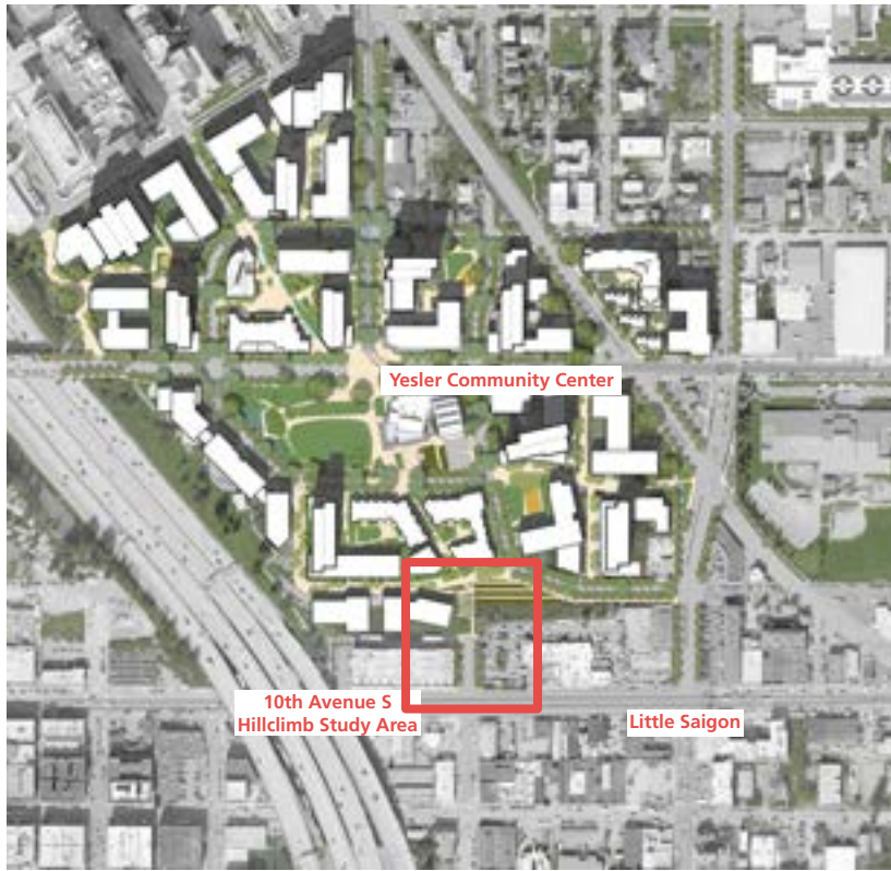
Vicinity Plan and Hill Climb Study Area