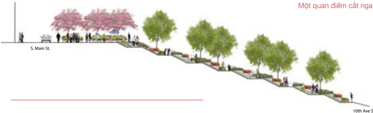
Một quan điểm cắt ngang