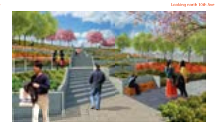
Looking north 10th Ave